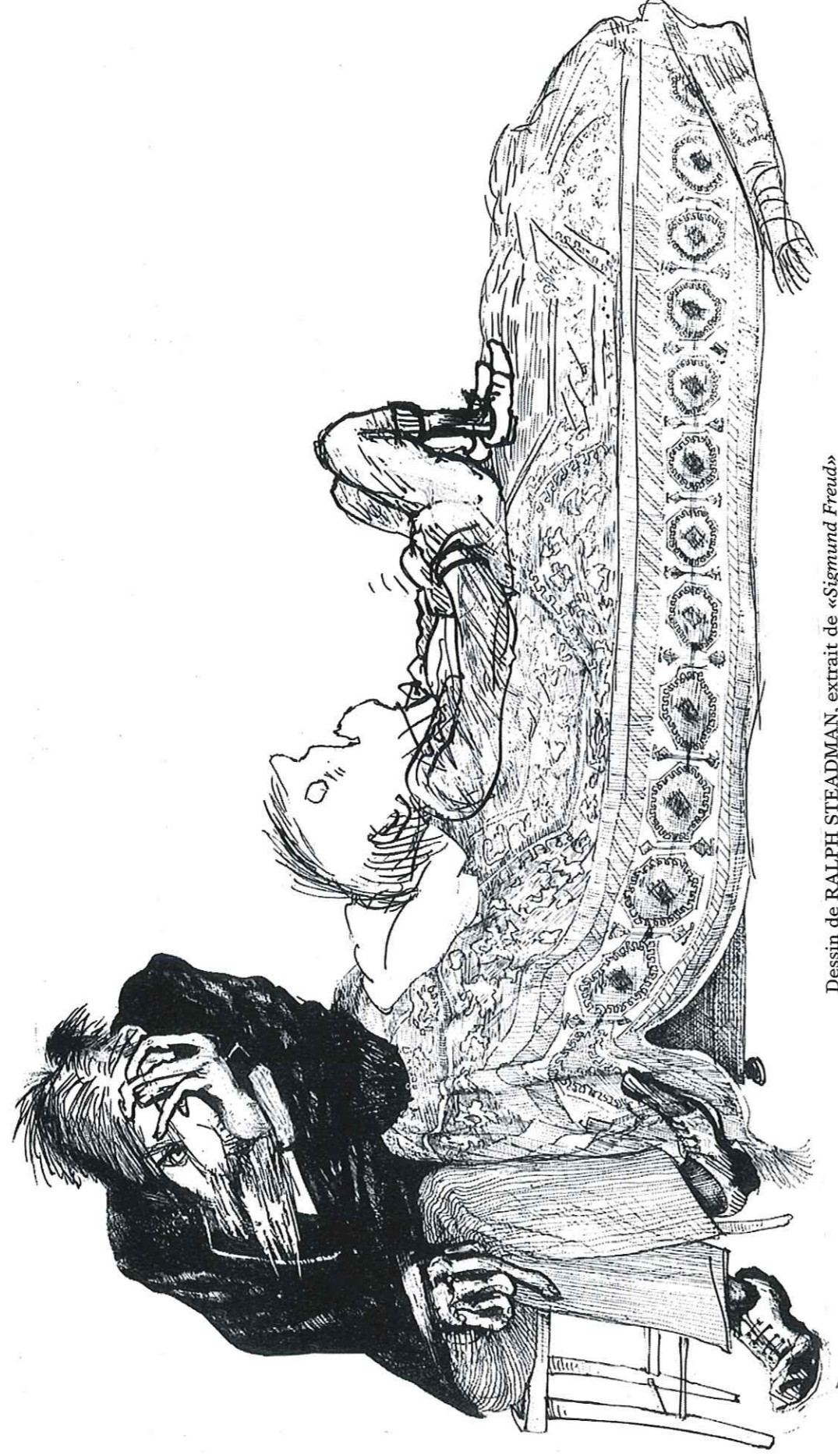
Dessin de RALPH STEADMAN, extrait de «Sigmund Freud»