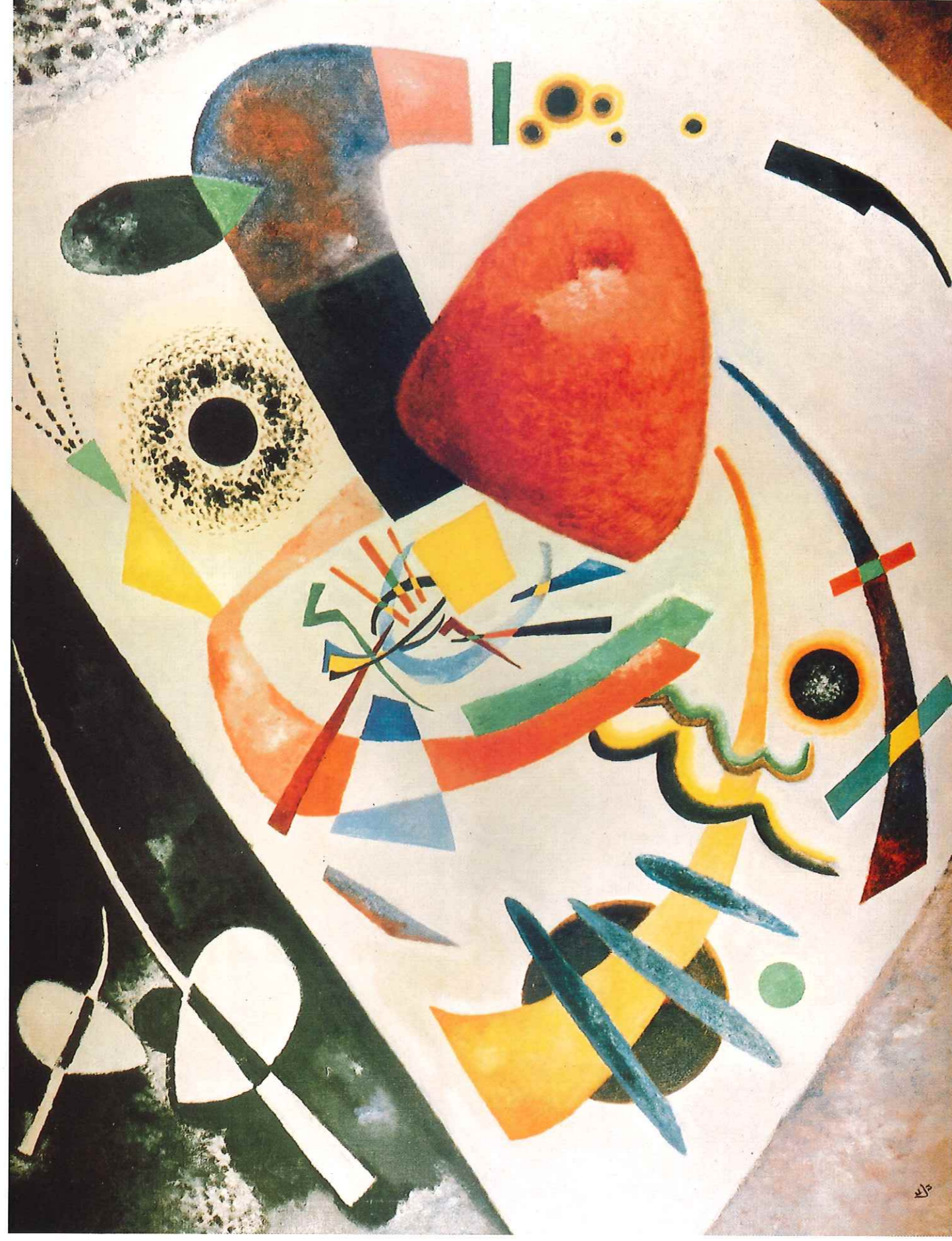
KANDINSKY : «Tache rouge II», 1921, Munich.