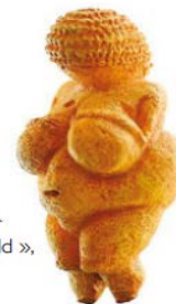
La Vénus néandertalienne de Willendorf

Être mère ? Qu'est-ce aujourd'hui ? Et qu'en dit-on ? Quel est le point de vue lacanien ? Les lignes bougent et l'actualité bruisse de mutations de toutes sortes. La presse, les blogs, les forums et les parutions récentes en reçoivent les échos. Deux fois par semaine, Flashes lacaniens se branche sur l'actualité pour vous proposer l'angle lacanien sur ces évolutions de l'Être mère aujourd'hui.